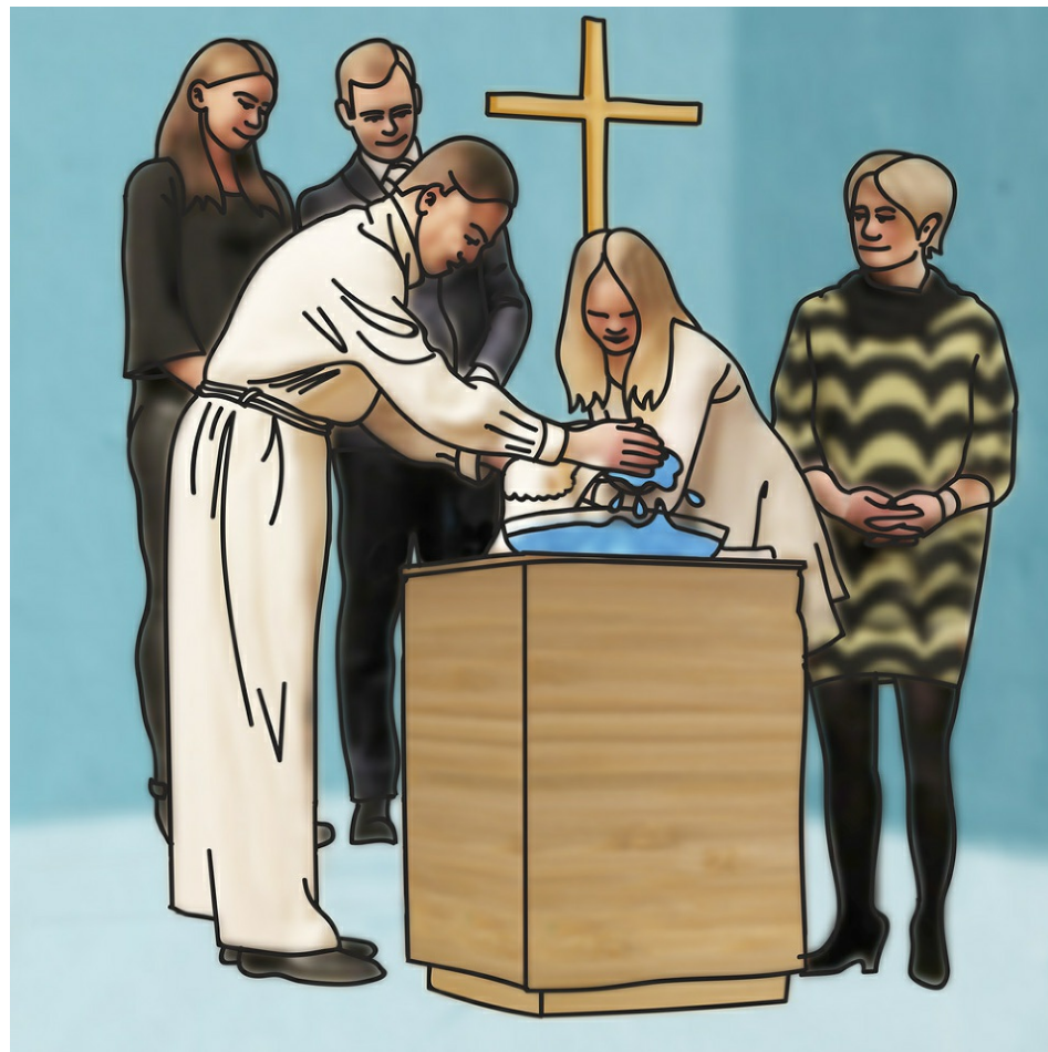
Det heliga dopet