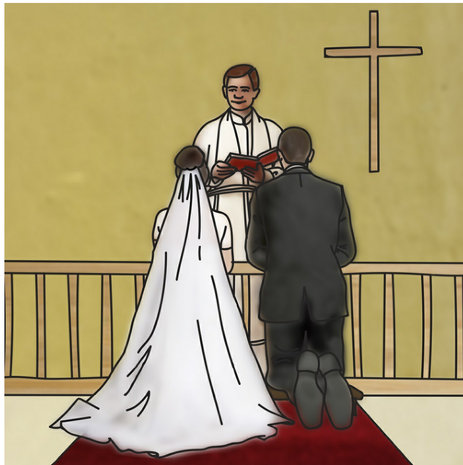
Brudparet böjer knä vid altaret.